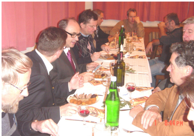
Die Mitglieder des Schachklubs bei einer Klubfeier

So besteht die Hoffnung, dass der Schachsport in Gars sich weiter entwickeln wird.