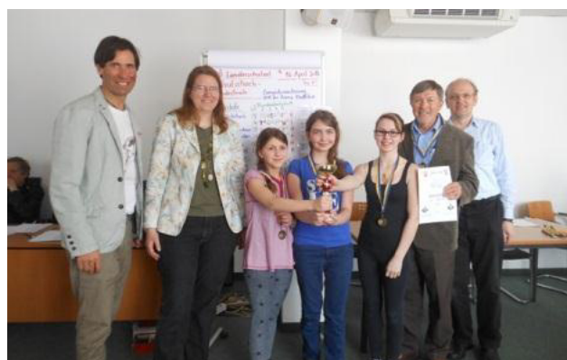
Sieger Mädchen: NNÖMS Litschau