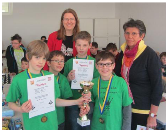
Sieger Volksschule: VS Eggenburg