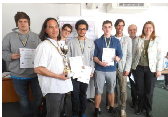
Sieger Oberstufe: BG/BRG Horn