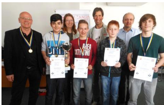
Sieger Unterstufe: BG/BRG Neunkirchen